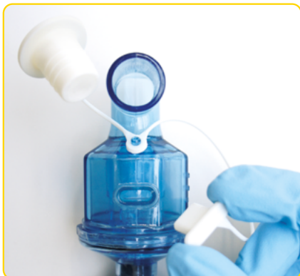
Vérifiez que chaque bouchon soit enlevé des nébuliseurs.