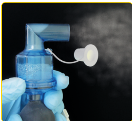
Vous devriez observer un léger brouillard.